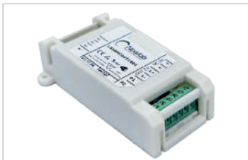
WIFI-DALI (L607MA04D1A21) WIFI-16DALI (L607MA04D1A22)